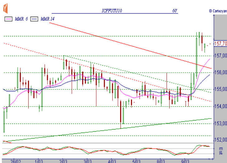
CAFÉ SETEMBRO/2010 BM&F (ICFU10)