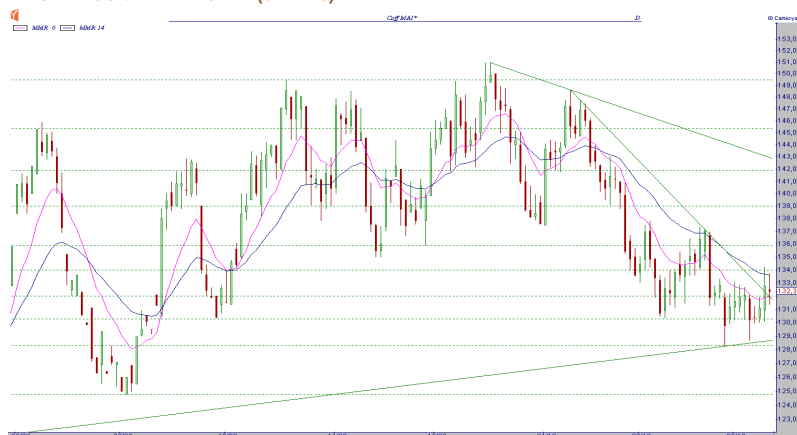
GRÁFICO CAFÉ MAIO NY (CFNK10)