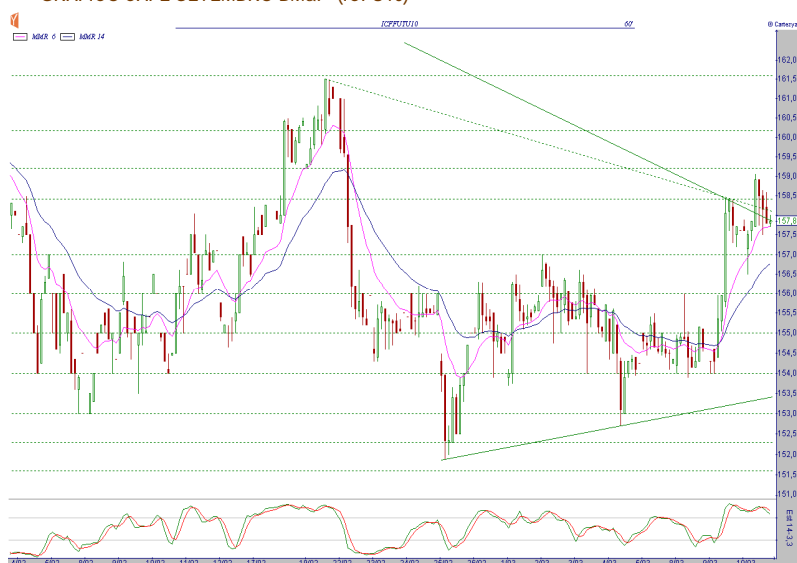
GRÁFICO CAFÉ SETEMBRO BM&F (ICFU10)