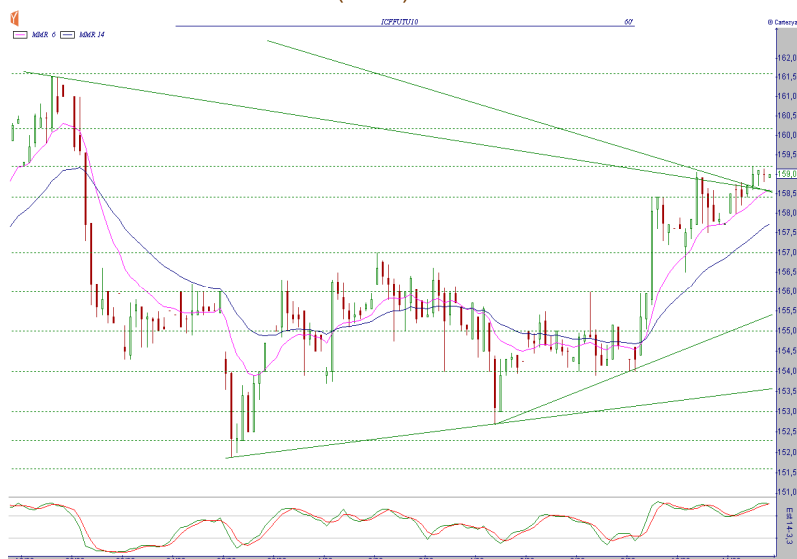
GRÁFICO CAFÉ SETEMBRO BM&F (ICFU10)